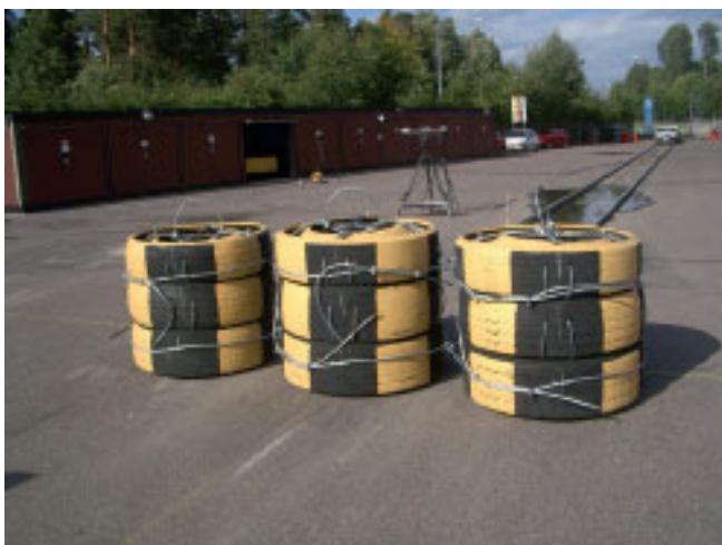
Fig 3. Uppställda i rad för största avstängningsbredd.