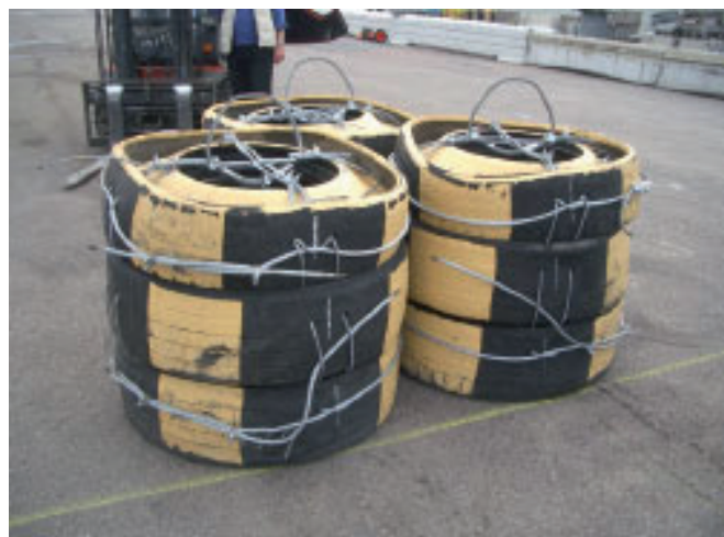
Fig 2. Uppställda som trekant. Schacklas ej mellan trave 1 & 3.